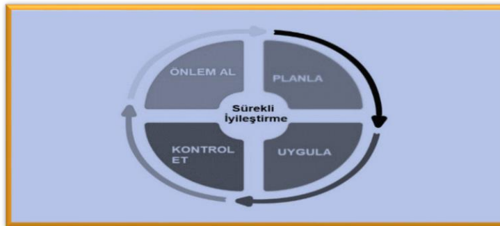
Şekil 1. PUKÖ Döngüsü

Yukarıda belirtilen adımlar özetle Planla-Uygula-Kontrol Et-Önlem Al (PUKÖ) yaklaşımı olarak ifade edilebilir (Şekil 1).